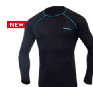
Funkční tričko s dlouhým rukávem

Materiál: 100 % polyester Velikosti: M - 2XL