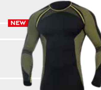
Funkční tričko s dlouhým rukávem

Materiál: 60 % carbon polyester, 32 % nylon, 8 % spandex Velikosti: M - 2XL