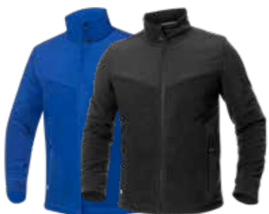
Hřejivá a prodyšná mikina

Materiál: 100 % polyester fleece, 280 g/m 2 , soft-shellová část: 96 % polyester, 4 % spandex Velikosti: M - 2XL